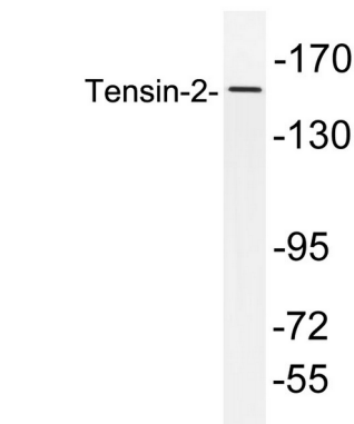
HepG2 세포를 사용하여 Tensin-2 항체를 사용하여 단백질 분석을 수행했습니다.