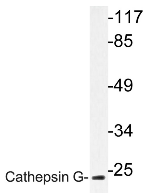
カテプシン G 抗体を使用した COLO 細胞溶解液のウェスタン プロット分析。